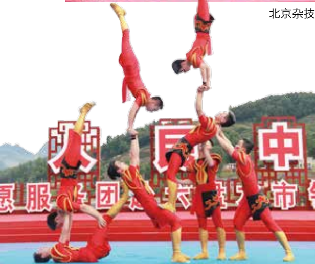
贵州省杂技团 杂技《男子造型》