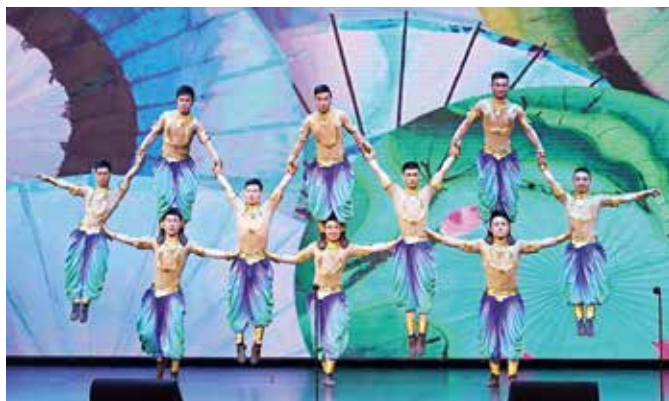
杂技《梦系西湖·伞技》剧照

际马戏节等活动……这些累累的硕果中凝结着几代曲杂人的心血和汗水，各级领导和专家对曲杂的关心和帮助，将支撑着我们脚踏实地一路前行。■