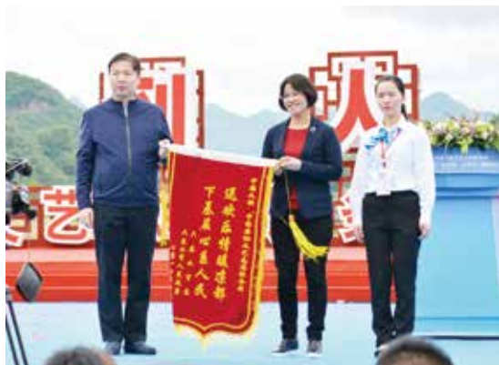
六盘水市向中国文联赠送锦旗