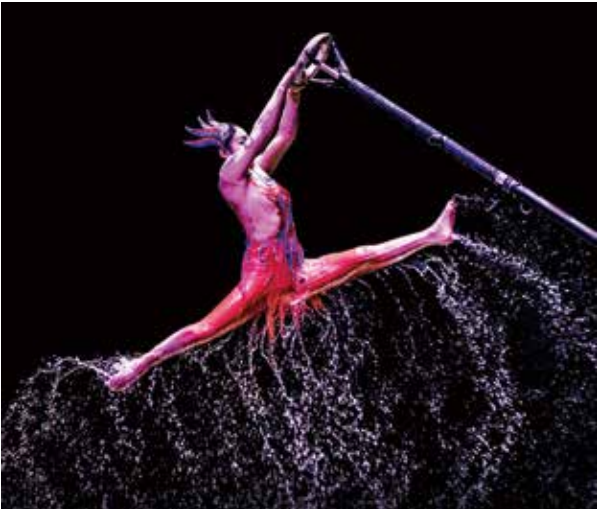
河南省杂技集团有限公司