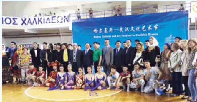
武汉市市长万勇、哈尔基斯市长等嘉宾与演员合影

哈尔基斯市是希腊历史古城，曾经是古希腊最大的城市，2015年6月4日与武汉市结成国际友好交流城市。此次武汉杂技演出借力“一带一路”走出去，弘扬了中国文化，推动了中希两大文明古国之间文化交流，为增进中希两国人民的友好感情做出了贡献。■