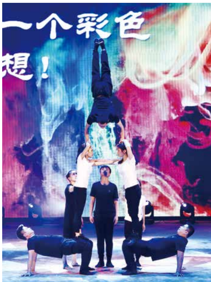
《思维创新·色彩碰撞》

让我们所有杂技人、所有有杂技情怀的人共同努力，让杂技教育创新永远在路上，让杂技走得更高更远！■