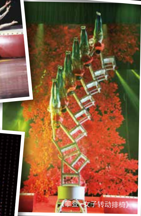
《攀登·女子转动排椅》