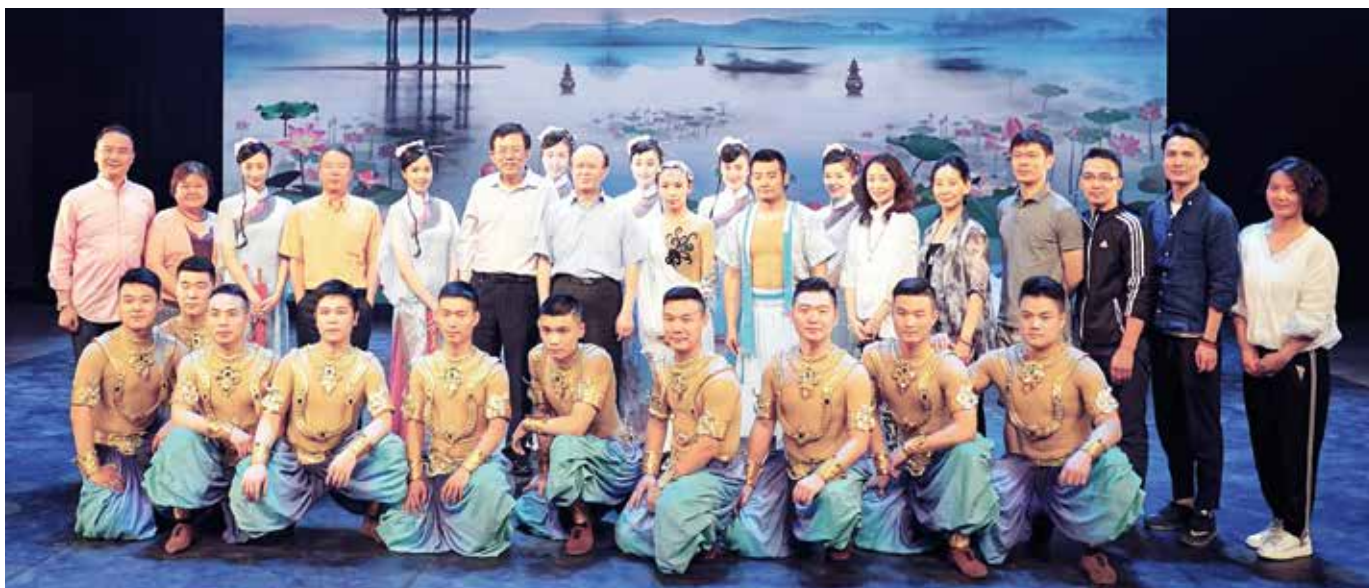
出发前，文化部副部长丁伟和外交部领导在北京与节目组合影留念