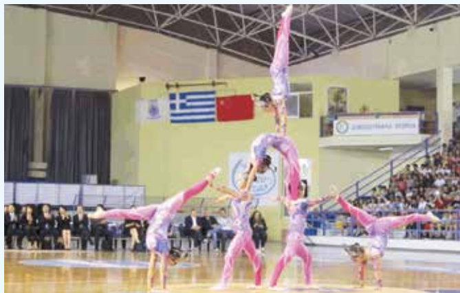
武汉杂技团表演《女子柔术》