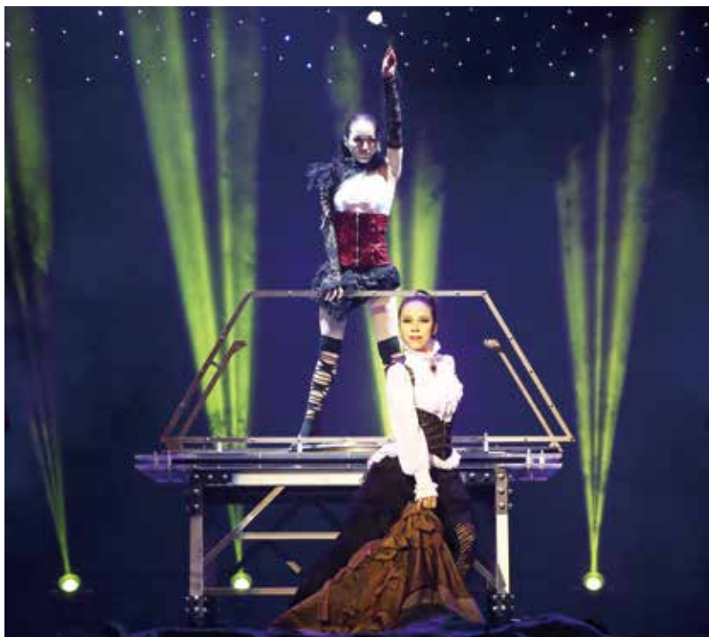
魔术《美女几何》获第九届中国杂技金菊奖第六次全国魔术比赛“金菊奖”

持总团工作的各位领导、各界朋友表示热烈欢迎！向为杭州杂技总团发展和壮大做出巨大贡献的各位老艺术家表示崇高的敬意！向为杭州杂技总团持续发展倾注智慧和力量的全体演职人员表示衷心的感谢！