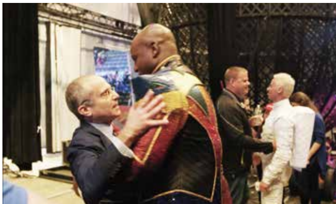
玲玲马戏团大老板菲尔德与演员告别