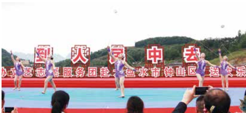
北京杂技团 杂技《妙舞炫竹》