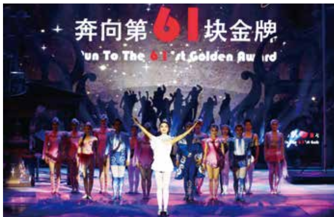
《奔向第61块金牌》剧照

中国杂技团新晚会《奔向第61块金牌》作为北京演艺集团第四届“梦想成真”五月演出季开幕序列作品，于2017年4月30日至5月1日在民族宫大剧院上演。这台晚会上半场从杂技演员的视角出发，诠释经典，绽放荣光：四个经典代表作品《俏花旦——集体空竹》《腾韵——顶碗》《协奏·黑白狂想——男女技巧》《圣斗——地圈》通过问鼎“金小丑”奖的发展历程及完美演艺，集中展现了中国杂技团“追求卓越、力塑经典”的艺术理念。晚会下半场呼应本届演出季“传承之旅”的主题：回顾来路薪火相继、岁月峥嵘，立足今天精彩节目桥段、缤纷汇聚，最后是憧憬未来的朝气蓬勃、奋力奔跑，细微之处可见中国杂技团“让世界观众看到最好的中国杂技”的美好追求。