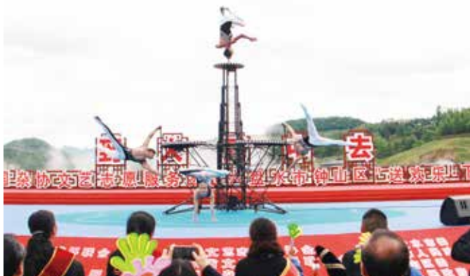
中国杂技团 杂技《黑白狂想——五人技巧》