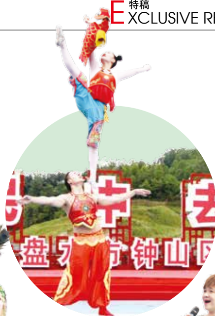
四川遂宁杂技团 杂技《男女双人技巧》