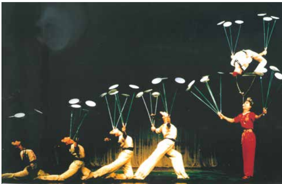
杂技《转碟》获1983年法国巴黎第6届明日杂技节“法兰西共和国总统奖”

“甲子轮回，薪火相传”。60年是历史，是丰碑，更是一个新的起点，全体“杭杂人”将深入学习贯彻习近平总书记在全国文艺工作座谈会上的讲话精神，发扬老一代艺术家在杂技艺术创作和演出中的“工匠精神”和为杂技事业奉献一生的无私精神，以高度的文化自觉和文化自信，不断丰富“精致内涵、大气开放”城市人文精神，沿着老一辈艺术家的脚步，不忘初心，努力拚搏，续写杭州杂技总团新的篇章，为杭州世界名城建设贡献自己的一份力量，用实际行动，迎接党的十九大胜利召开。■