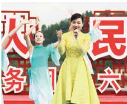
陈思思 歌曲《不忘初心》