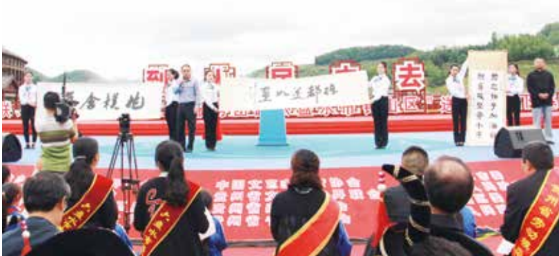
书法家向六盘水市赠送书法作品