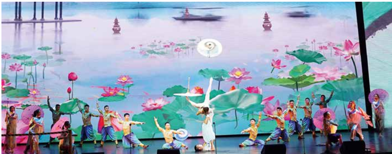
杂技《梦系西湖·伞技》剧照