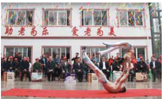
大兴东杂技团表演杂技《冰与火》