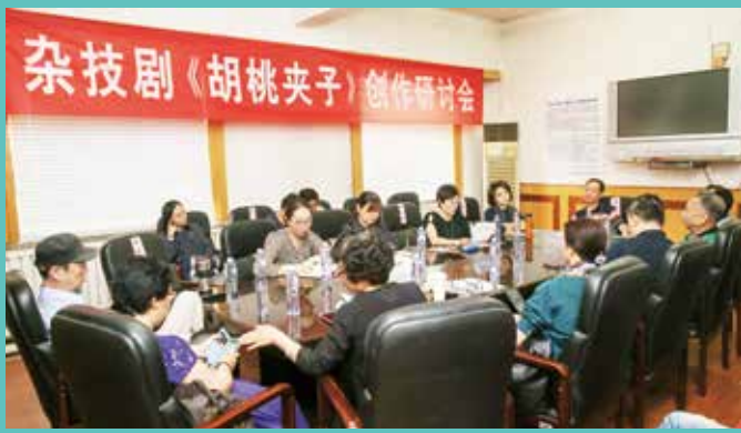
《胡桃夹子》创作研讨会会场