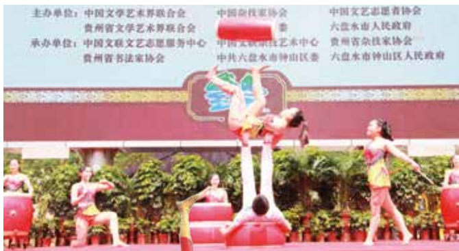
北京杂技团 杂技《蹬鼓》