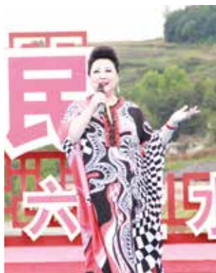
郑咏 歌曲《我爱你中国》