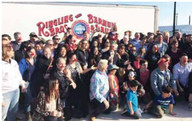
曾经的“玲玲人”从各地赶来与“玲玲”告别

1971年，迪斯尼乐园在奥兰多开放。玲玲马戏团着手在迪斯尼乐园旁建立一个马戏主题乐园，几经周折，乐园于1976年开放。然而这种狂欢游行的乐园无法和迪斯尼乐园相提并论。1984年马戏乐园关闭。