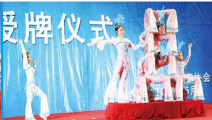
学生们表演《女子柔术》