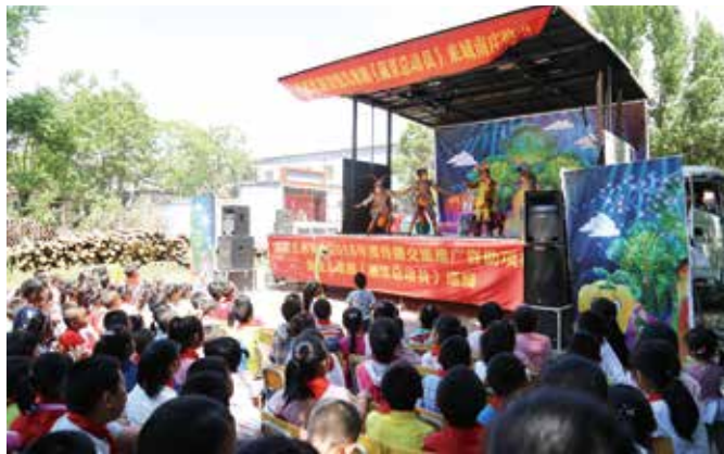
在阜平县城南庄村演出

此次巡演,演出剧组走过的是一条发扬革命传统、继承革命精神的学习教育之路。巡演旅途中有多个革命根据地。阜平县城南庄是我国第一块敌后抗日革命根据地核心区域,聂荣臻元帅在此领导晋察冀军民抗战长达10年之久。毛泽东等党和国家领导人在从陕北到西柏坡转移过程中在此召开城南庄会议。城南庄决策,插响了中原会战的战鼓;唐县黄石口村是伟大的国际共产主义战士白求恩牺牲的地方;涞水县三坡镇松树口村,是冀热察挺进军兵工厂的所在地、平西革命根据地的腹地,是聂荣臻、肖克等老一辈革命家战斗过的地方;涞水县山南村,1939年3月7