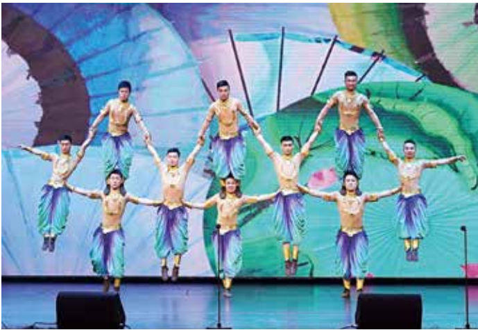
浙江曲艺杂技总团