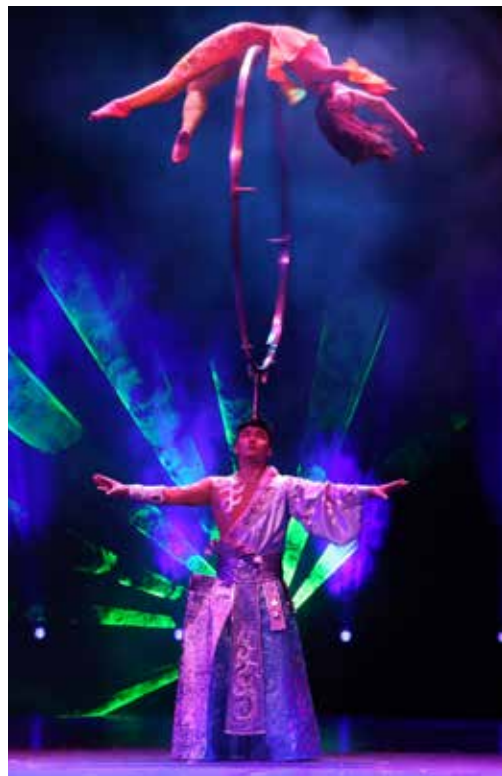
杂技《顶环》获2016年法国瓦兹河谷第17届国际马戏节最具独创奖和特别荣誉奖