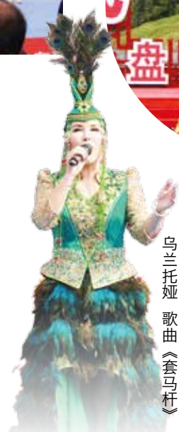
乌兰托娅 歌曲《套马杆》